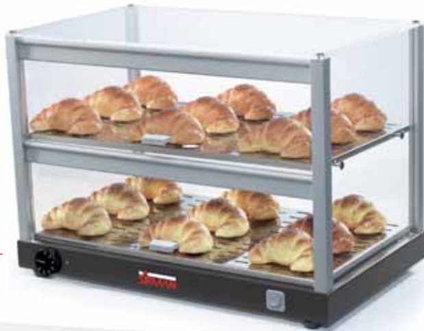
CUBE P2 HOT