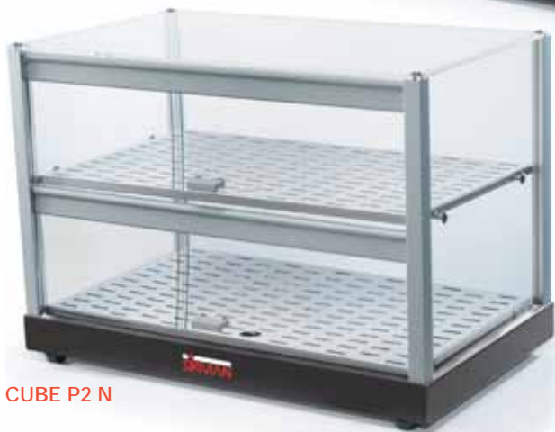
CUBE P2 N