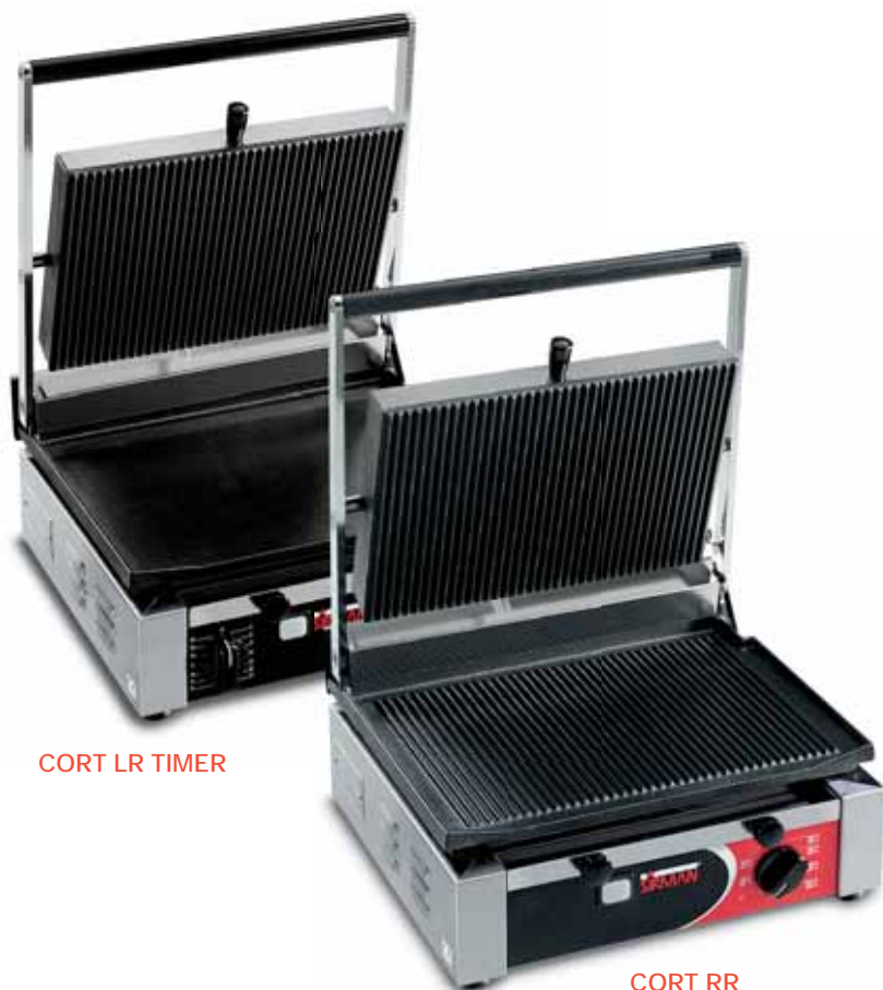
CORT LR TIMER