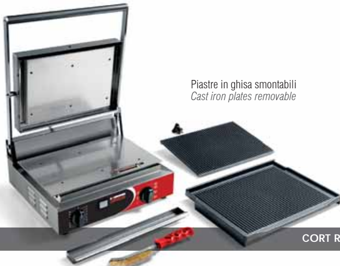
CORT RR PS TIMER

Piastre in ghisa smontabili Cast iron plates removable