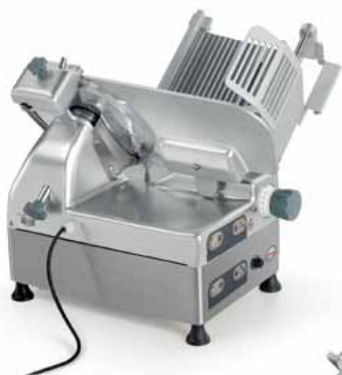
Spazioso piano per appoggio prodotto Large tray