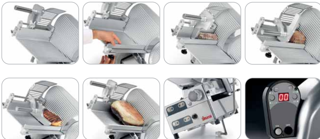
Leva sollevamento, opzionale Lifting lever, optional